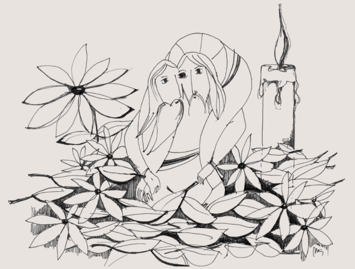
ILUSTRAÇÃO DA ARQ. MARIA TAVARES