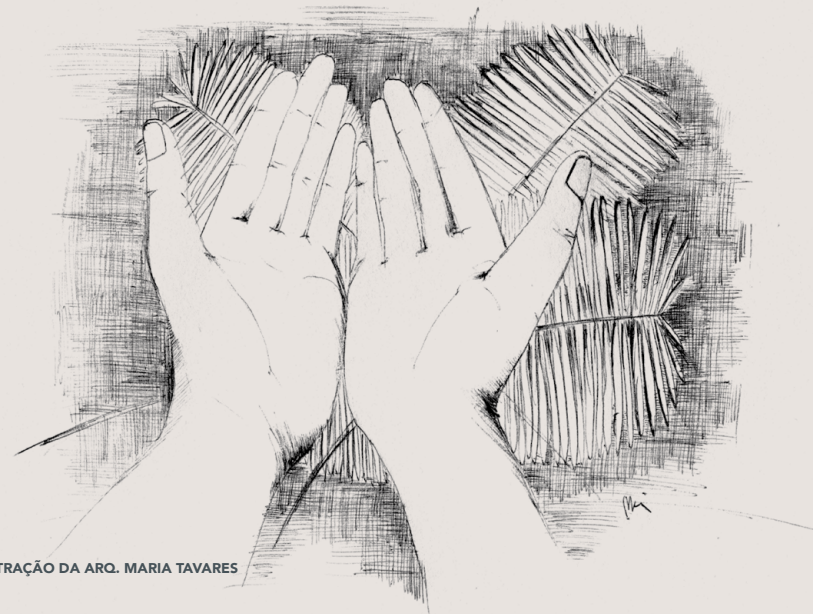
ILUSTRAÇÃO DA ARQ. MARIA TAVARES