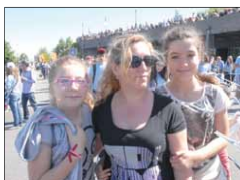
Peregrinação Arquidiocesana ao Santuário do Sameiro Braga, 1 de Junho