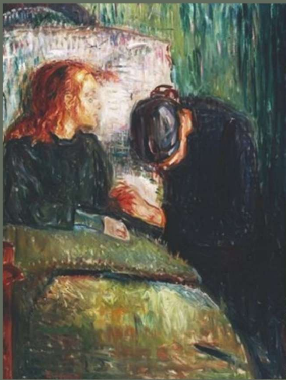
A Menina Doente - Munch