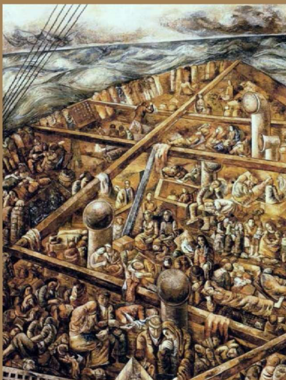
Navio de Emigrantes - Segal